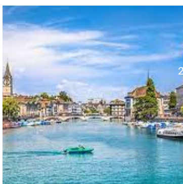
Lago de Zurique