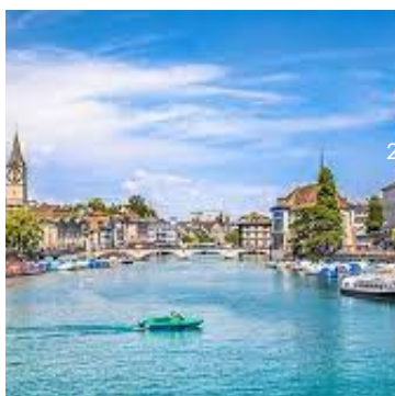
Lago de Zurique